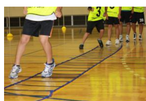
③④ラダー ・いろいろなステップを 踏みながら進みます