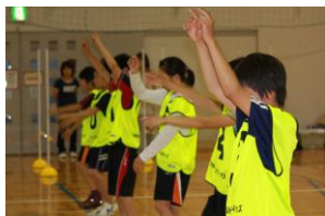
①リトミック運動 ・右手は3拍子、 左手は2拍子!?