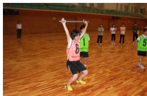
②フルスクワット ・棒を持って背筋を 伸ばします