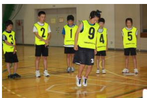
⑥ヘキサゴン ・六角形のラインを 前後左右にジャンプ